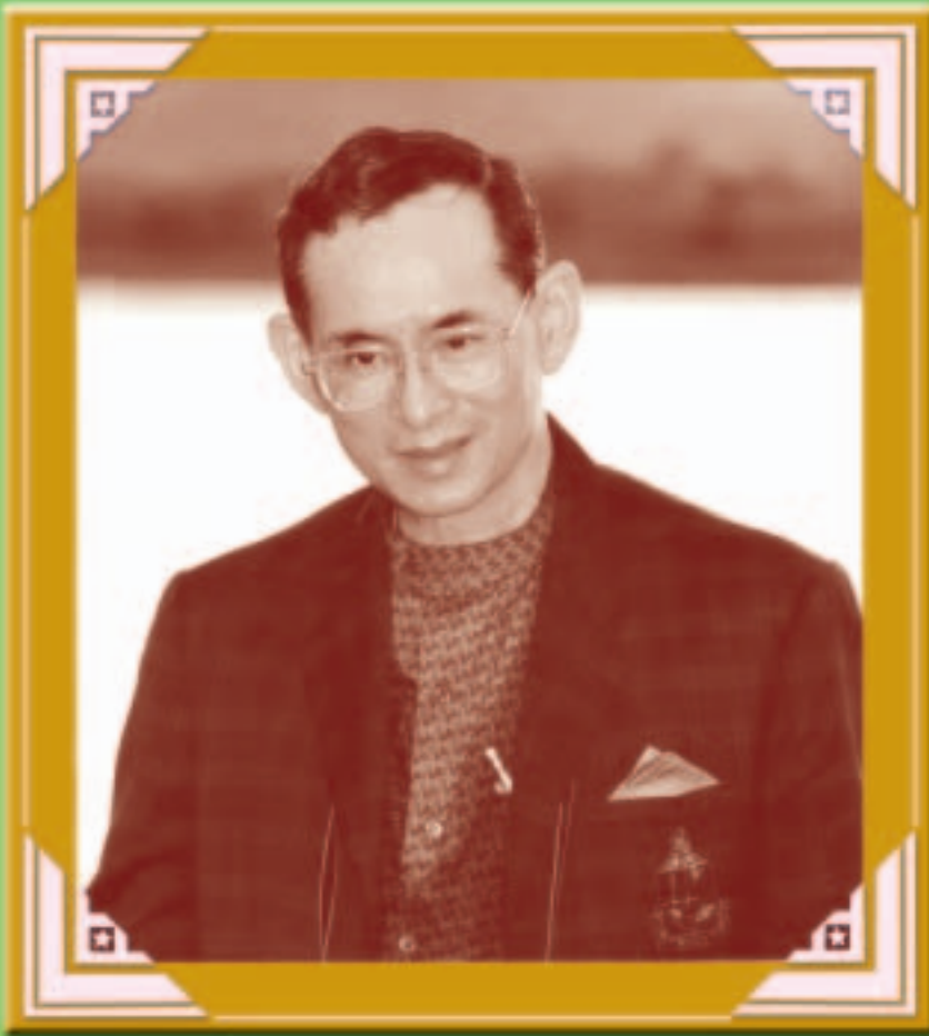
พระบรมราชาโชวาท ของ พระบาทสมเด็จพระเจ้าอยู่หัว ภูมิพลอดุลยเดชฯ ทรงพระราชทานแก่ข้าราชการพลเรือน เนื่องในวันข้าราชการพลเรือน ปีพุทธศักราช 2547

“ผู้ปฏิบัติราชการ จำเป็นต้องรู้วิทยาการ ฐานะ และรู้ดีรู้ชั่ว อย่างกระจ่างชัด จึงจะสามารถปฏิบัติบริหารงานในความ รับผิดชอบให้ถูกต้องตรงตามเป้าหมาย และสัมฤทธิ์ผลที่เป็น ประโยชน์เป็นความเจริญที่แท้จริงและยั่งยืน ทั้งแก่ตนเอง และส่วนรวม ”