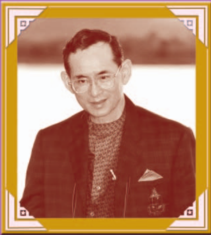
พระบรมราชาโชวาท ของ พระบาทสมเด็จพระเจ้าอยู่หัว ภูมิพลอดุลยเดชฯ ทรงพระราชทานแก่ข้าราชการพลเรือน เนื่องในวันข้าราชการพลเรือน ปีพุทธศักราช 2547

“ ผู้ปฏิบัติราชการ จำเป็นต้องรู้วิทยาการ ฐานะ และรู้ดีรู้ชั่ว อย่างกระจ่างชัด จึงจะสามารถปฏิบัติบริหารงานในความ รับผิดชอบให้ถูกต้องตรงตามเป้าหมาย และสัมฤทธิ์ผลที่เป็น ประโยชน์เป็นความเจริญที่แท้จริงและยั่งยืน ทั้งแก่ตนเอง และส่วนรวม ”