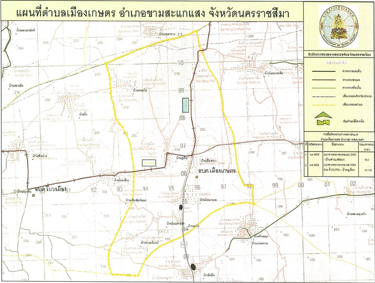
แผนพัฒนาท้องถิ่น (พ.ศ. ๒๕๖๖ - ๒๕๗๐) ฉบับทบทวน เปลี่ยนแปลง ครั้งที่ ๑/๒๕๖๕ ขององค์การบริหารส่วนตำบลเมืองเกษตร อำเภอขามสะแกแสง จังหวัดนครราชสีมา