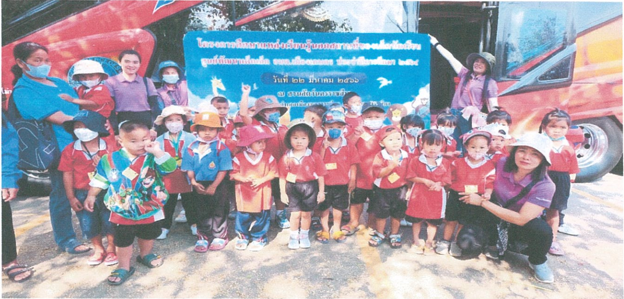
๑๓. โครงการเพิ่มประสิทธิภาพการปฏิบัติงานด้านการป้องกันและบรรเทาสาธารณภัย