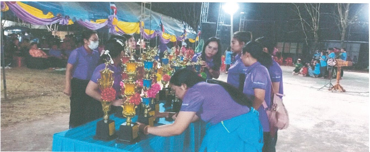
๑๗. โครงการส่งเสริมการเข้าร่วมแข่งขันกีฬา ศูนย์พัฒนาเด็กเล็กสัมพันธ์