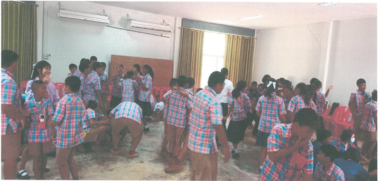
๘. โครงการปลูกต้นไม้เพื่อ เฉลิมพระเกียรติฯ