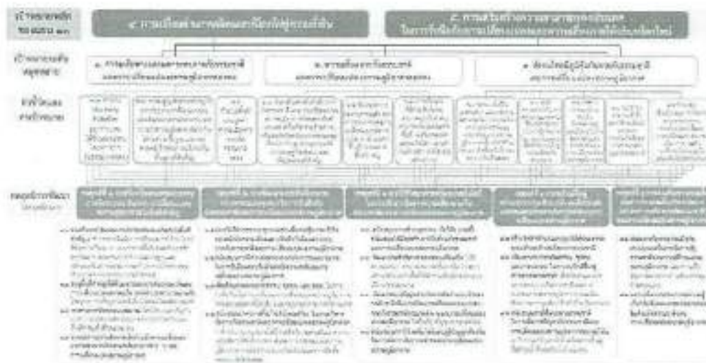
๓. แผนที่กลยุทธ์