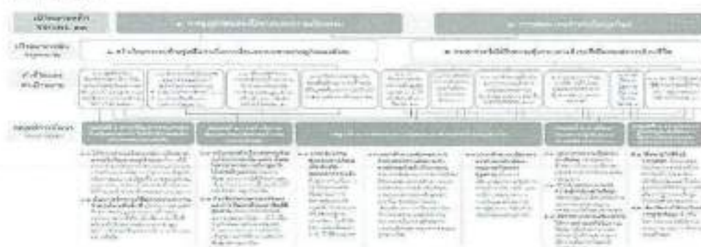
๓. แผนที่กลยุทธ์