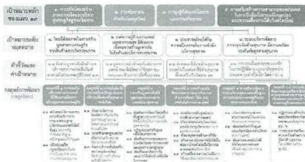
๓. แผนที่กลยุทธ์