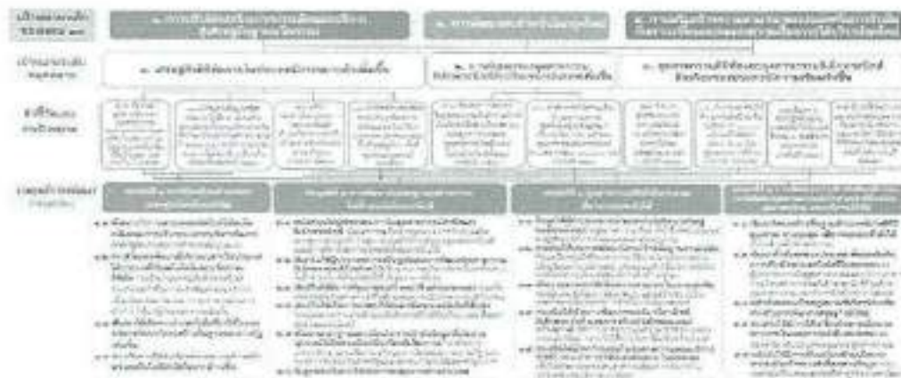
๓ แผนที่กลยุทธ์