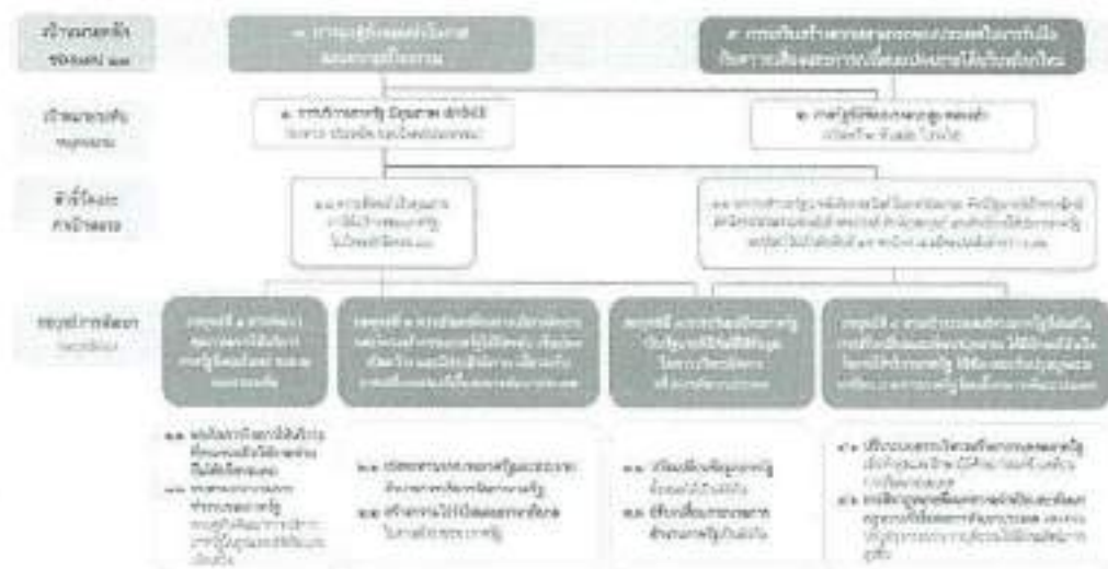
๓. แผนที่กลยุทธ์