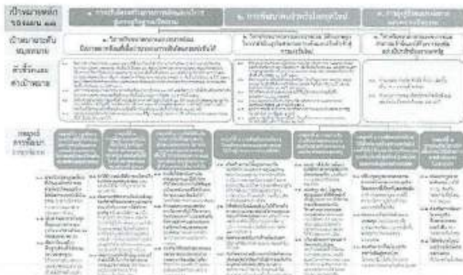
๓. แผนที่กลยุทธ์