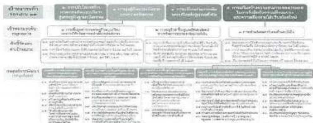
๓. แผนที่กลยุทธ์