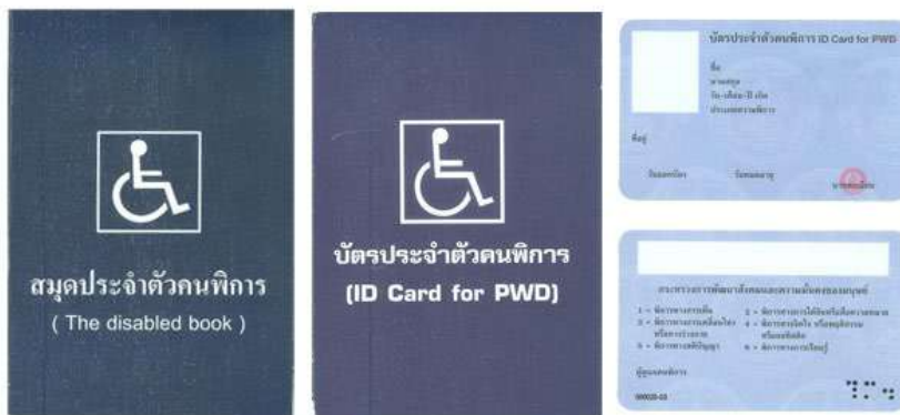
ตัวอย่างบัตรและสมุดประจำตัวคนพิการ

อย่าลืม !!!! นะจ๊ะ มีบัตรแล้ว ต้องรีบมา ลงทะเบียน